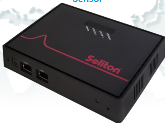
NetAttest LAP Cloud Sensor